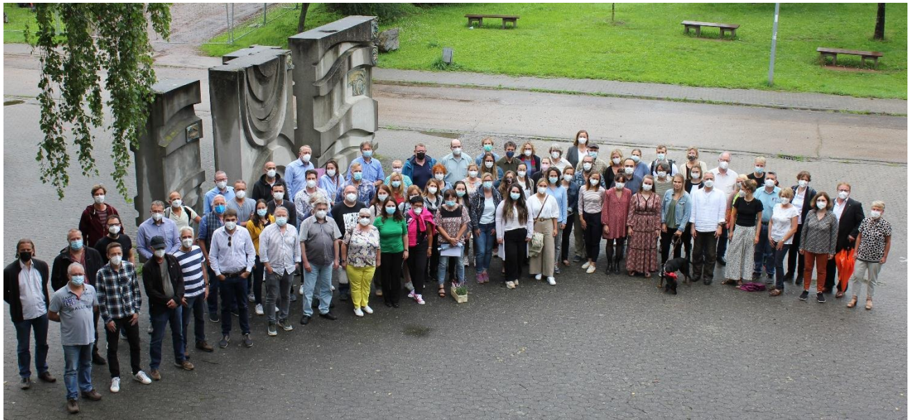
Das Kollegium der KHSW im Jahr 2021